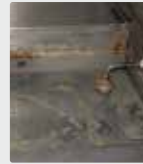
Bir restoranda izgara tabağı