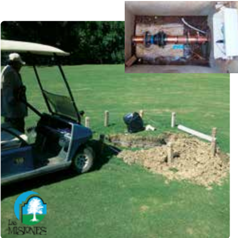
Vulcan, Las Misiones Golf Sahası'nda yeraltına kuruldu