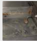
Bir kulüp restoranında ızgara tabağı