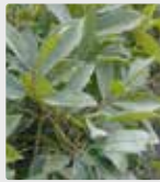
Bitkiler ve çim