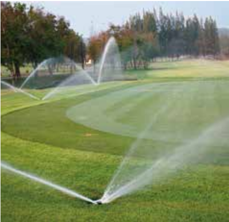
Golf sahasında yağmurlama sistemi