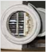
Yüzme havuzu filtresi